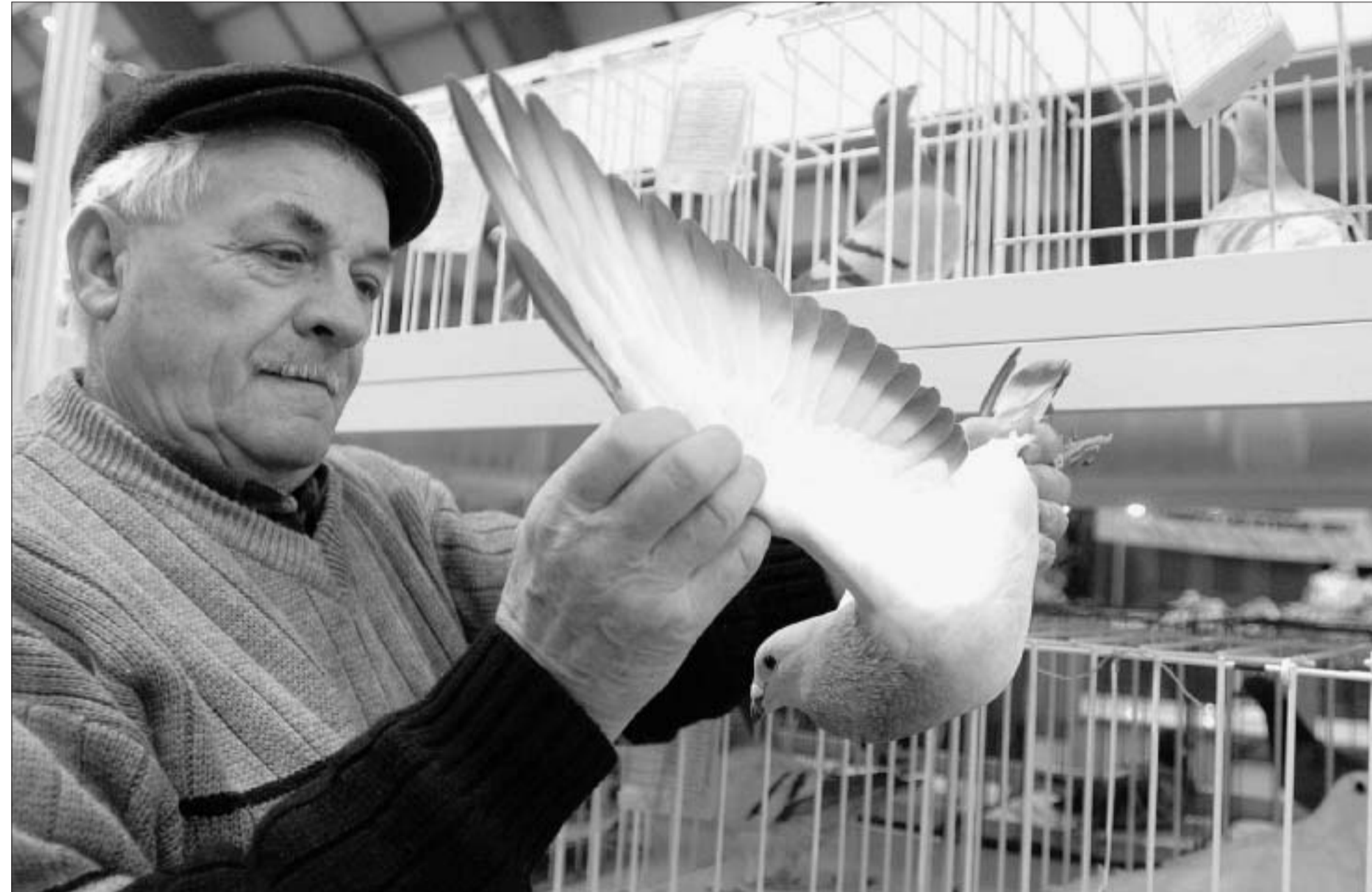
Ce week-end, plus de 1 000 pigeons sont exposés dans un Sportica métamorphosé en colombier géant.