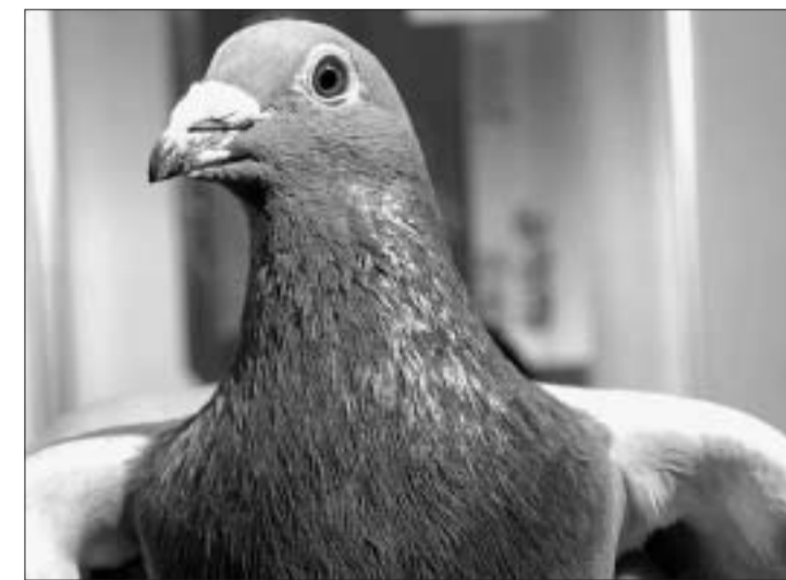
Le monde du pigeon a généré son propre vocabulaire, parfois haut en couleur.

Le monde de la colombophilie ne pourrait se concevoir sans quelques expressions et techniques qui font son charme. Petite excursion en terre des mots du pigeon.